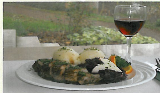
Hier weiß der Gast, was er auf dem Teller hat, denn für diese Mahlzeit wurden überwiegend regional erzeugte Lebensmittel verarbeitet.

Vor diesem Hintergrund ist die Entwicklung und Umsetzung innovativer Absatzmöglichkeiten für regionale Produkte sowie die Entwicklung von Erlebnis-Arrangements das Hauptziel dieser Initiative. Dafür sollen landwirtschaftliche Betriebe und Anbieter von Dienstleistungen genauso angesprochen werden, wie Abnehmer regionaler Produkte (bspw. Großküchen) und Verbraucher.