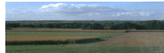
Regionaltypische Landschaft bei Groesbeek (Niederlande)

Das Kerngebiet des Projektes liegt in einem Radius, der sich etwa 50 Kilometer rund um die Städte Nimwegen und Kleve erstreckt. Dazu gehören u.a. der Niederrhein, die Gelderse Poort, die Betuwe und Nord-Limburg.