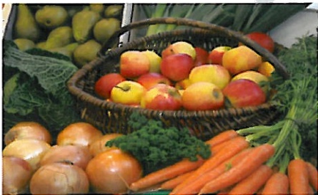
Frisches Obst und Gemüse aus regionalem Anbau

Die landwirtschaftlichen Betriebe in der Euregio Rhein-Waal stehen heute angesichts des voranschreitenden Strukturwandels mehr denn je vor der Herausforderung, ihr Unternehmen auf innovative Art weiterzuentwickeln. Die Landwirte möchten hochwertige Produkte erzeugen und dabei eine verantwortungsvolle Herstellung und Tierhaltung gewährleisten. Gleichzeitig müssen sie um Absatzmöglichkeiten in der globalisierten Welt konkurrieren. Da dieser Spagat nicht einfach ist, muss nach innovativen Möglichkeiten gesucht werden, die eine rentable und langfristige Betriebsführung sichern.